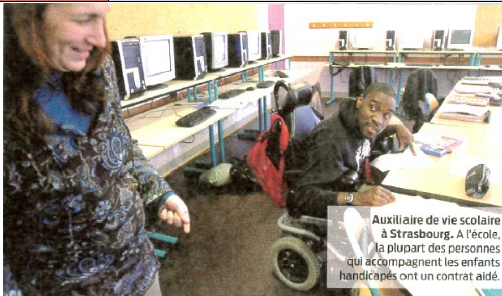
Auxiliaire de vie scolaire à Strasbourg. A l'école, la plupart des personnes qui accompagnent les enfants handicapés ont un contrat aidé.