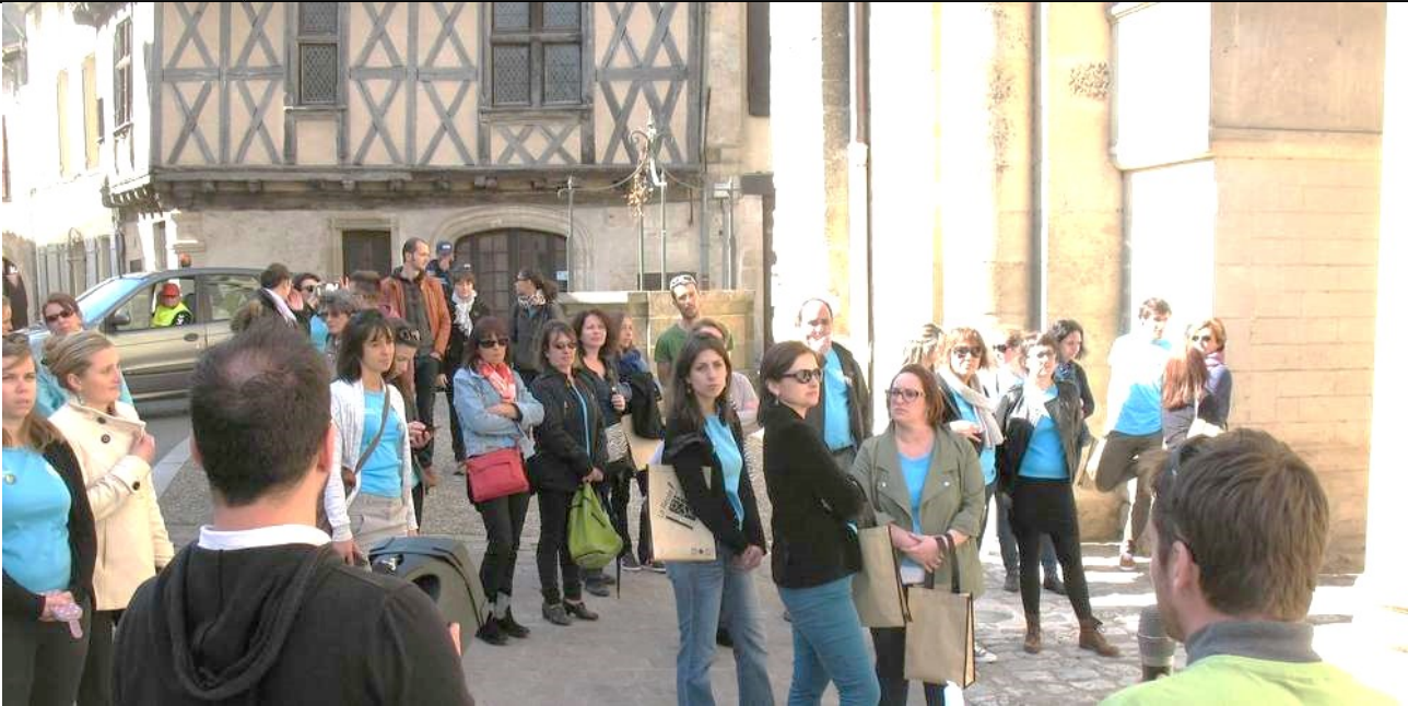
SOURCE : La Réole, ancien hôtel de ville photo P.L, Sud-Ouest mardi 12 septembre 2017.

La Réole est une ville en plein accroissement . Sa population est passée de 4200 à 4500 habitants durant les cinq dernières années.