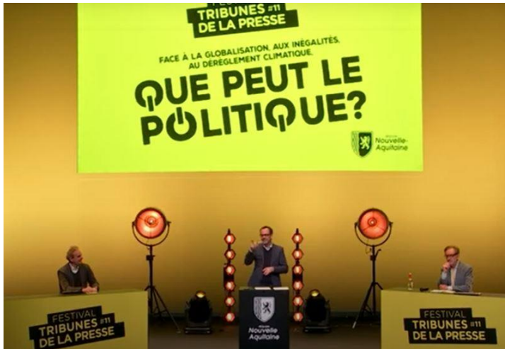
5 Débat 2

Donald Trump a quitté la Maison blanche tout comme Benjamin Netanyahu en Israël. Au Brésil, le président Bolsonaro est contesté. Idem pour le Premier ministre indien Modi. Et l'on pourrait allonger la liste... Est-ce à dire que le populisme fait de moins en moins recette à travers le monde? À voir ce qui se passe ailleurs, y compris en Europe ou à ses frontières, mieux vaut se garder de tout jugement précipité.