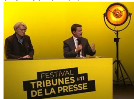
4 Jean-Claude Mailly et Manuel Valls