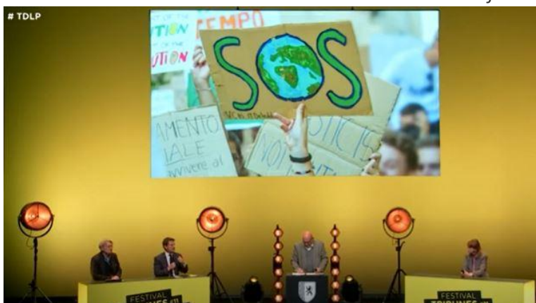
2 Débat 1

Les politiques ont du pouvoir mais ils n'ont pas tous les pouvoirs. D'autres lieux, d'autres acteurs existent : les médias, les syndicats, les lobbys, le tissu associatif... Ces contre-pouvoirs sont multiples, d'une importance inégale, ancrés dans l'histoire ou éphémères ; certains agissent dans l'ombre, d'autre en pleine lumière. Mais tous ont en commun d'être incontournables et de savoir se faire entendre.