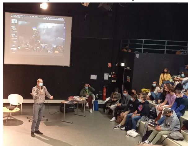
7 Atelier Eric Bouvet